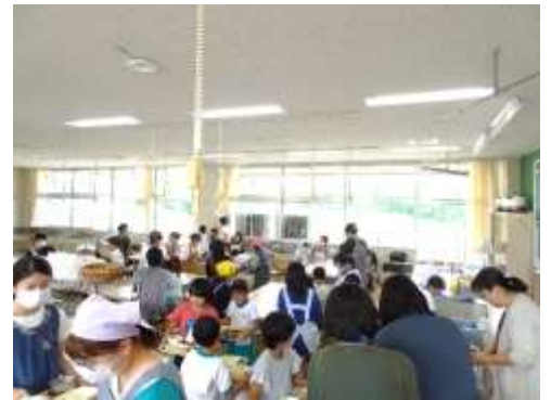
久しぶりの親子給食試食会

1年生は3日(火)、栄養指導と給食試食会です。はじめに普段給食の献立作りをして下さっている給食センターの栄養教諭の先生をお招きし、食事の大切さを楽しく学びました。その後、会場を家庭科室に移動して給食試食会を行いました。最近ではコロナ禍で控えていたが久しぶりの試食会になったとのこと。いつもとは少し違った雰囲気親子で楽しく給食をいただきました。