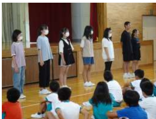
各委員会からの連絡、お願い

2日（火）、1学期最後の児童朝会がありました。今月の歌、執行部から6月の生活目標の反省と7月の取り組みの確認、また、各委員会からの連絡、呼びかけがありました。7月の生活目標は「言葉づかいに気をつけよう」です。「ふわふわ言葉」を使い、呼び捨てはしないなど相手への思いやりを大事にするまとめにふさわしい目標です。みんなでしっかりと意識をし、気持ちのよい1学期の締めくくりとしたいものです。