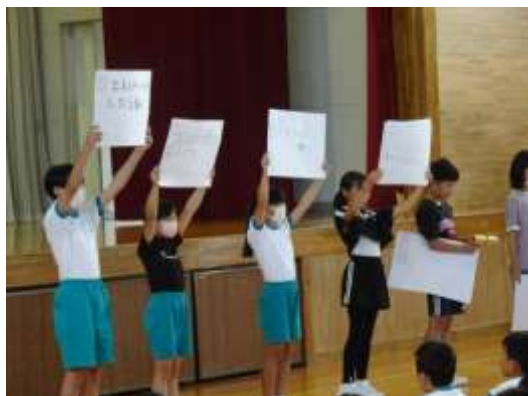
給食委員会の発表

また、今回は給食委員会の発表当番で、給食で出される食品の働きを知るクイズが用意されていました。給食委員の皆さん、ありがとうございました。