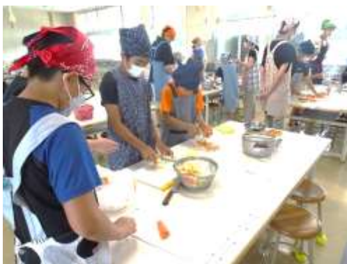
真剣！おいしいカレーになあれ

5年生は6日(土)、8月の終わりに予定している宿泊体験学習の野外炊飯に向けて、カレー作りを行いました。作り方を確認し、その後はグループにわかれて調理にかかりました。皮むきや材料切り、そして煮込みなど本番をイメージし、お家の方からアドバイスももらいながら完成させることができました。出来栄もとてもおいしかったそうです。